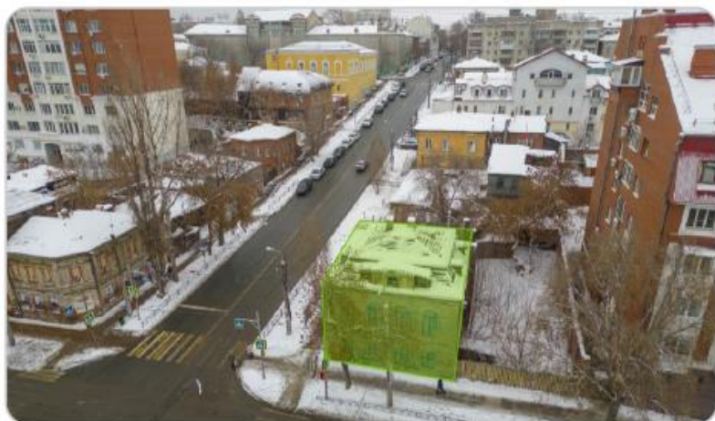
«Дом П.Е. Каткова», Комсомольская, 15/ Водников, 39