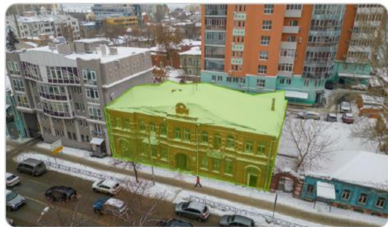
«Дом Юрина», Льва Толстого, 83