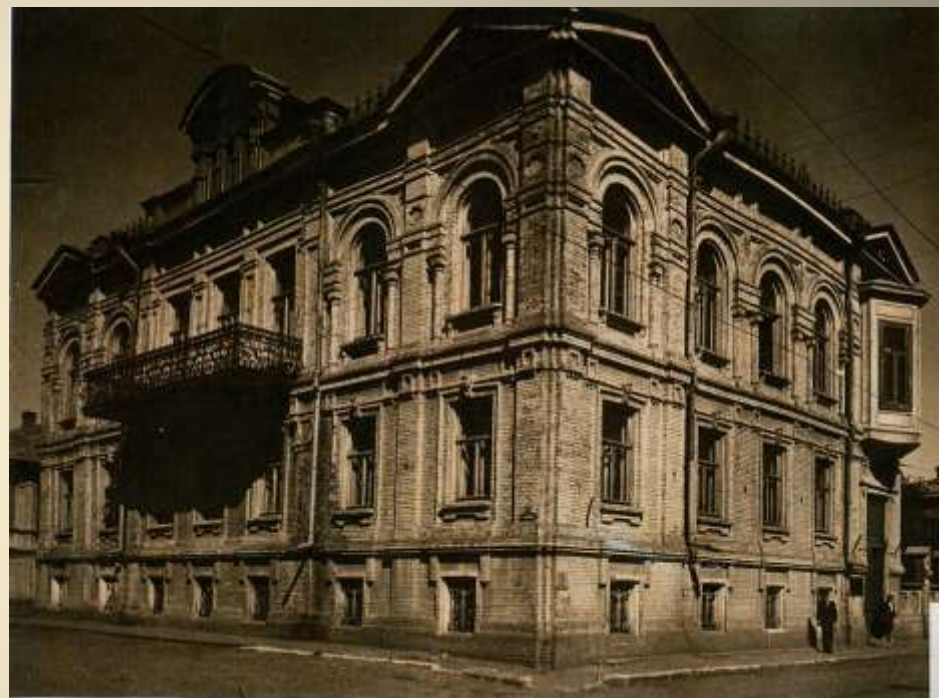
Астраханская картинная галерея им. П.М. Догадина Городская усадьба Плотниковых