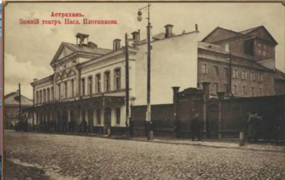
Астраханский драматический театр Усадьба Плотниковых